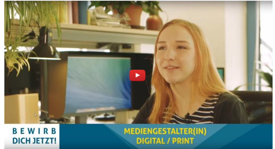
Bild klicken und Video ansehen